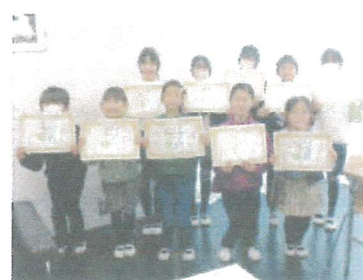
新児童会役員「がんばります！」

3月弥生です。6年生にとっては旅立ちの春がもうそこまで来ています。3月はバトンタッチの時期でもあります。6年生を送る会や卒業式の取り組みを通して、おおたかの森小学校の伝統をしっかりと引き継いで欲しいと思います。先日は児童会役員の引き継ぎ式を行いました。1年間役員をしっかりと勤め上げた6年生からは、一年間の活動を振り返っての思いが、新しく役員に選ばれたメンバーからは今年度の活動をさらに発展させて、これから自分たちの学校をどうしていきたいのか、抱負が語られました。みんなで心をつなげて、すばらしい学校を目指そうという意欲があふれた会となりました。