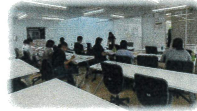
1次試験打合せの様子

本校では準会場として英検1次試験をサポートしています。今回は、110名を超える生徒が受験をしました。1次試験に合格した生徒は、2次面接に進むため面接のサポートを行っています。まずは、入室から面接官とのやり取り、点数を取るポイントなどを確認します。生徒さん達はとても緊張している様子ですが、サポーターの皆さんは丁寧に一人一人に合ったアドバイスをしてくださっています。