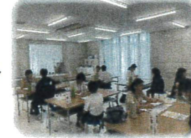
2次面接練習の様子