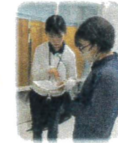
英語科の先生より 再度アドバイス