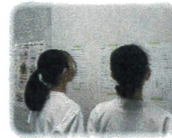
面接の流れ ポイントの確認

本校では準会場として英検1次試験をサポートしています。今回は、110名を超える生徒が受験をしました。1次試験に合格した生徒は、2次面接に進むため面接のサポートを行っています。まずは、入室から面接官とのやり取り、点数を取るポイントなどを確認します。生徒さん達はとても緊張している様子ですが、サポーターの皆さんは丁寧に一人一人に合ったアドバイスをしてくださっています。