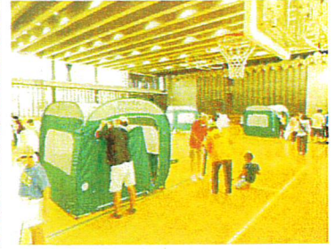
実際に防災テントを設置