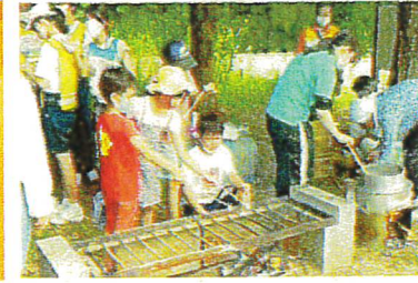
かまどベンチでマッシュマロ