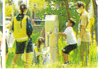
防災用井戸を実際に体験

本日の反省点・問題点を確認し、災害に備え、地域住民が安全に避難できるように今後も避難所運営訓練を継続的に実施していきたいと考えております。