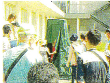
簡易トイレの設営