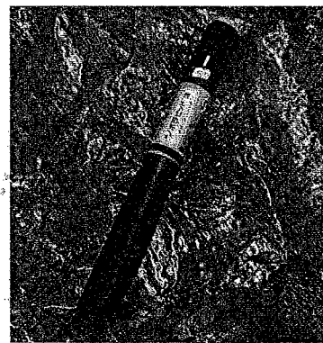
インスリン注射器 (ペン型注射器)