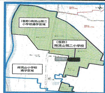
南流山地区 通学区域