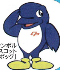
シンボル マスコット 「シーボック」

発行者 千葉県警察本部 〒260-8668 千葉市中央区長洲1丁目9番1号 ☎043-201-0110