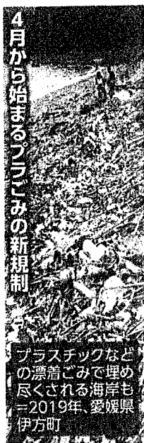
4月から始まる「プラスチックごみの新規制」