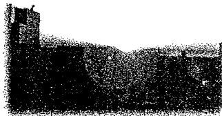
心に残っている風景 房総半島から上る朝日