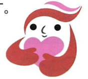
犯罪被害者等支援シンボルマーク 「ギョットちゃん」

犯罪や事故に巻き込まれた被害者の方やそのご家族が、被害から立ち直り、平穏に暮らすためには、地域の皆様のご理解とご協力が必要です。