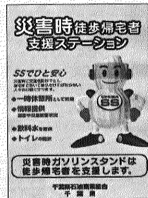
千葉県消防協会 千葉県