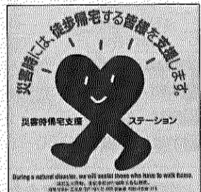
千葉県を含む九都府県が協定を締結